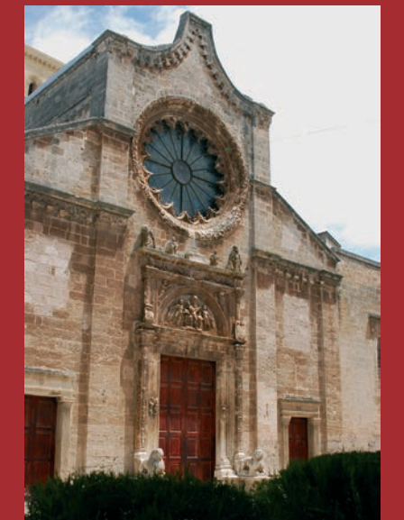
Chiesa Collegiata SS. Trinità, Manduria

Lo 'sventurato' Marugj, genesi e poesia di un delitto.