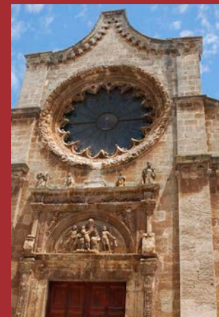
Particolari frontespizio Chiesa Collegiata SS. Trinità, Manduria (Taranto)