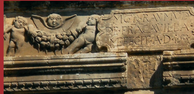
Particolare frontespizio Chiesa Collegiata SS. Trinità, Manduria, datazione dell'opera e nome dell'Autore